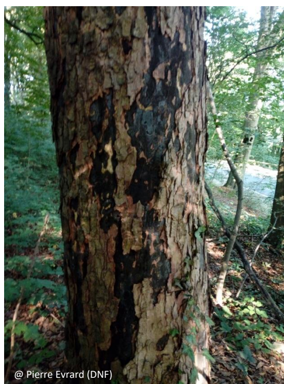
Perchis d'érable sycomore totalement infectés dans la région de Jemeppe-sur-Sambre